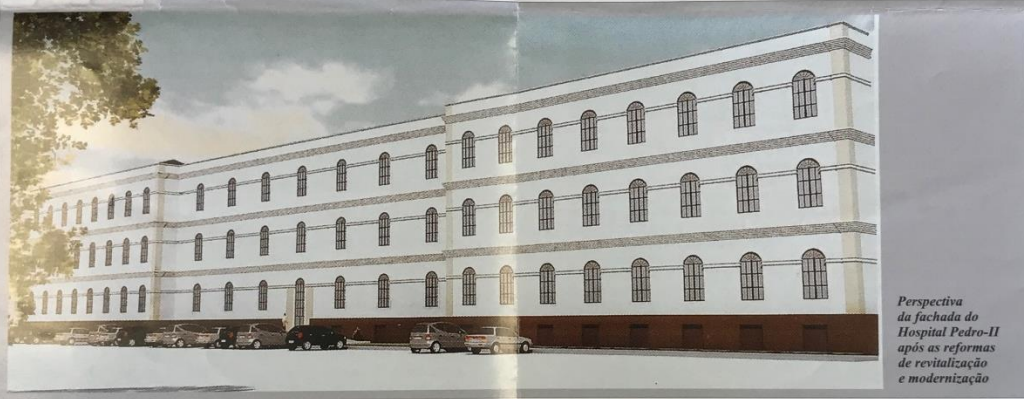
Perspectiva da fachada do Hospital Pedro-II após as reformas de revitalização e modernização