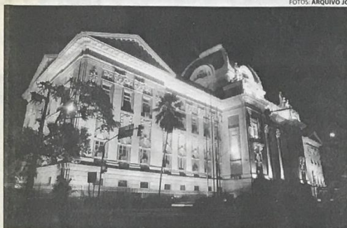
PROJETO Tribunal, tombado como Patrimônio Estadual e repleto de mesclas estilísticas, é um projeto do arquiteto grego Giacomo Palumbo